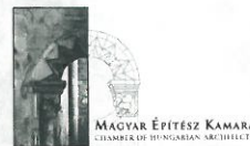
MAGYAR ÉPÍTÉSZ KAMARA