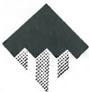
ÉPÍTÉSI VÁLLALKOZÓK ORSZÁGOS SZAKSZÖVETSÉGE